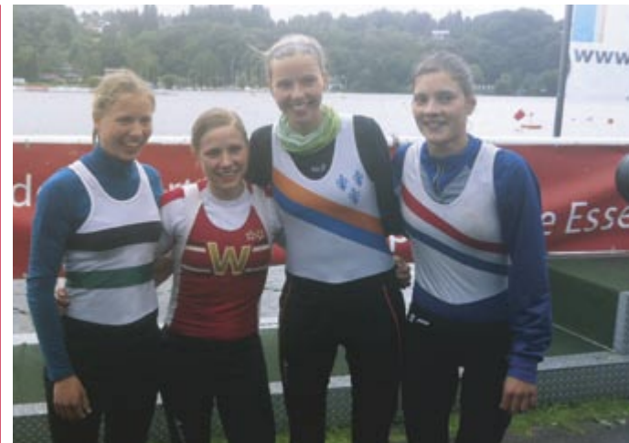
Bekannte Gesichter: Der Lgw. Juniorinnen Doppelvierer ohne Steuerfrau