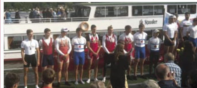
Siegerehrung zum Männer 8+. Es gilt die Silbermedaille.