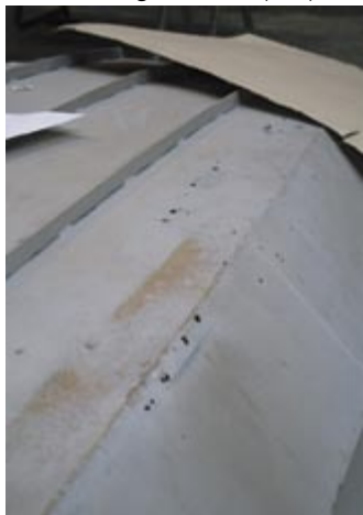
Loch an Loch ...

Nach Jahren, in denen nur die nötigsten Arbeiten an dem Inselboot „Orje“ gemacht wurden, sollte in diesem Jahr das Unterschliff gezielt bearbeitet werden. Dies war der Beginn einer (fast) un-