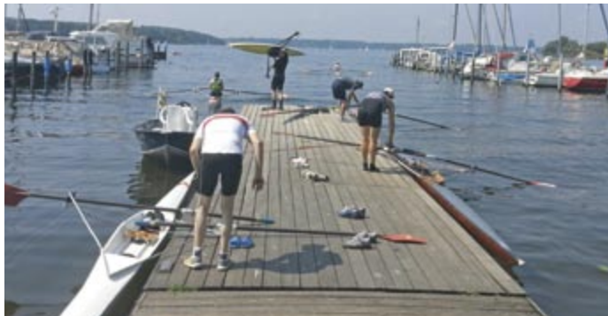
Auf zur nächsten Einheit ...

Punkten etwas lernen, nicht nur aus dem eigenen Video. Am Sonntag ging es mit der Hitze