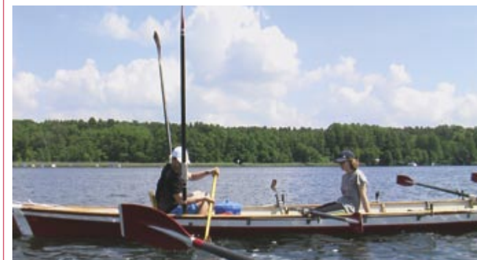
In Pausen wurde auch öfters der Rückenwind ausgenutzt. Dazu sehen wir hier einen Ansatz, um die Segelfläche zu vergrößern

Abend sehr deutlich. Der Weg nach Storkow war gesäumt von vielen Pausen und drei Schleusen, die unseren Weg kreuzten. Auf dem letzten Stück des Weges war es besonders schön warm, und so kam es zu einer Wasserschlacht. Nach der Abkühlung ging es weiter, wobei wir uns auch ein wenig Zeit ließen, da noch viel Zeit bis zum Abend blieb. Als wir schließlich in Storkow ankamen, wurden zuerst die Zelte aufgebaut. In den kleineren Zelten wurden die Mittelleute „gesandwich“, während andere ein Überangebot an Platz in ihren Zeltpalästen hatten. Anschließend wurde gebadet, die Wanderfahrtsneulinge „getauft“, einige sicherlich nicht ganz freiwillig,