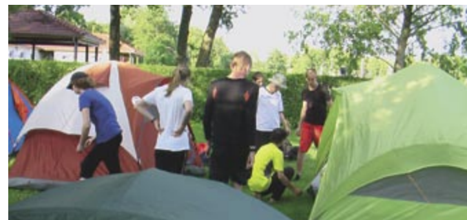
Die Fahrtenteilnehmer inmitten unserer Zeltstadt.

Heute morgen wollten wir alle um halb neun aufstehen. Der Großteil war allerdings schon vorher wach und saß schon auf dem Steg. Dann haben wir alle (zu unserem Entsetzen) ohne Salami gefrühstückt. Nach dem Zusammenpacken sind wir losgefahren. Während der 35-km-Etappe hing die Mannschaft der Vier Muskeltiere etwas hinterher. Das Wetter war ja auch mittlerweile zu schön zum Rudern geworden. Die anderen warteten und nutzten die Zeit für eine kurze Eispause an einem Strand. Da das Warten noch etwas andauerte, wurden Freundschaften mit den lokalen Enten geschlossen. Die Vier Muskeltiere fand unterdessen auch neue Freunde bei anderen Ruderkameraden, die die Ankunft des Bootes bei den Wartenden ankündigten. Als wir dann kurz