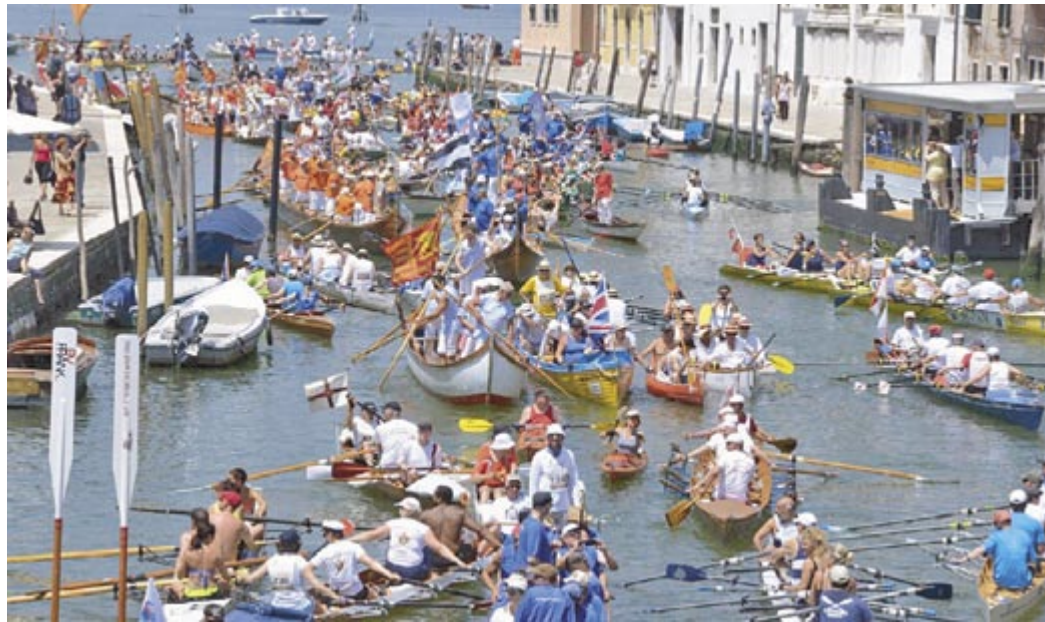
... und nochmal im Cannareggio

Am Samstagmorgen trafen sich alle 30 Ruderer zum Aufzettel, manche mit einem flauen Gefühl im Bauch, ob wohl beim Zu-Wasser-Lassen der Boote alles gut gehen würde. Geschichten aus den vergangenen Jahren ließen uns böse hohe Spundwände fürchten. Wir erwarteten haarsträubende und kraftraubende Aktionen, bis auch nur ein Boot im Was-