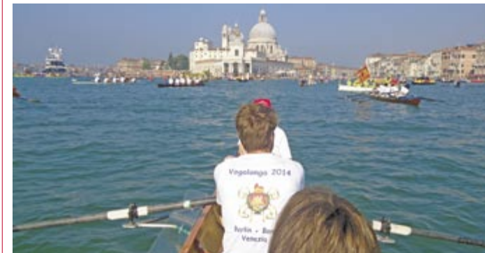
Der Start vor dem Markusplatz

So fühlten auch wir uns von der Serenissima gerufen und kamen gleich mit sechs Vierern.