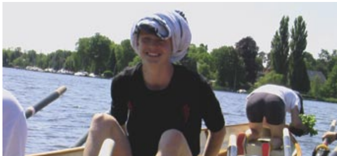
Das warme Wetter verlangte das Tragen angemessener Kopfbedeckung und das regelmäßige Wässern des Fahrtenbasilikums.

Mit S-Bahn und Tram sind wir morgens vom S-Bahnhof Wannsee bis zur Nixenstraße gefahren. Dort haben wir die Boote aufgeriggert und startklar gemacht. Nachdem die Boots-einteilung bekannt gegeben