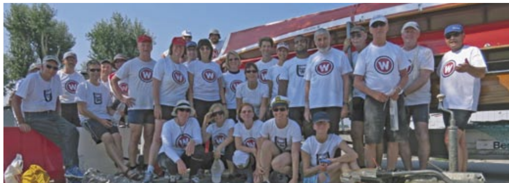
Die Vogelonga-Fahrer 2014

Die Boote starten in kurzen Abständen hintereinander. Daher kommt es auf der Strecke immer wieder zu packenden Spurts und Konterspurts. Dazu ist Steuermannkunst gefragt. Los geht es für etwas mehr als einen halben Kilometer an der Insel Großer Rohrwall stadtein-