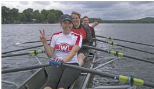
Zusammen

wärts, dann durch eine 180-Grad-Kurve stadtauswärts. Es folgt ein 1,5 Kilometer langes Stück in die andere Richtung und im großen Bogen um das Eiland Kleiner Rohrwall vorbei am Bootshaus der RG Rotation zurück zum Ziel. Hier kündigt sich der Endspurt an, der spätestens anzuschieben ist, wenn die erste Insel wieder in den Augenwinkeln auftaucht. Danach schneller Mannschaftswechsel, Regenerieren an Land und dann wieder aufs Wasser.