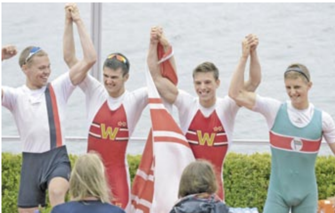
So sehen Sieger aus: Gold im Junior Vierer-ohne