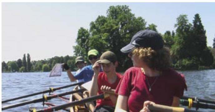
Uneinigkeiten über den aktuellen Kurs werden durch das Sichten der Karten beseitigt.

verpasst hatten, den wir eigentlich hätten nehmen müssen. Deshalb mussten wir umdrehen und die ganze Strecke wieder zurück rudern. Eines der Boote ist vorher durch die Welle eines (typisch für den Vatertag) leicht bedudelten und viel zu schnellen Motorbootfahrers mit Wasser vollgelaufen, was die allgemeine Stimmung auf Motorbootfahrer deutlich senkte. Die meisten anderen Motorbootfahrer waren zwar auch angeheitert, aber machten hauptsächlich eher lustige Sprüche. Das Highlight des Tages war dann die Fahrt