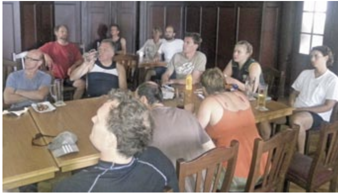
Alle folgen konzentriert der Videoauswertung

Am Samstag trafen sich die Teilnehmer bei zunächst noch neblig-trübem Wetter um 9 Uhr am Steg, um die Boote einzuteilen und sich bei dem "Trainer" Linus Lichtschlag und Organisator Ulf Baier noch einmal vorzustellen (d.h. Rudererfahrung, Erwartungen, etc.). Dann ging es zur ersten Einheit aufs Wasser, Richtung Cecilienhof. Dabei verteilte sich das Feld mit den 12 Teilnehmern bald über das spiegelglatte Wasser, während die ersten vom Motorboot aus Verbesserungshinweise erhielten und auf Video aufgenommen wurden. Vor Cecilienhof gab es dann eine kurze Pause, auf dem Rückweg wurde die andere Hälfte gefilmt und gecocht. Inzwischen war der Himmel aufgerissen und die Sonne deutete schon auf eine sehr heiße zweite Tageshälfte hin. Im Bootshaus wurden über Mittag die Videoaufnahmen ausgewertet, konstruktive Kritik geübt, auf dass in der zweiten Einheit, nun Richtung Griebnitzsee Ende mit viel Verkehr, die ersten Fehler behoben werden sollten. Das gelang auch