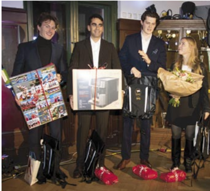
Geschenke: Die Jahrescollage, die Kaffeemaschine und die Rucksäcke