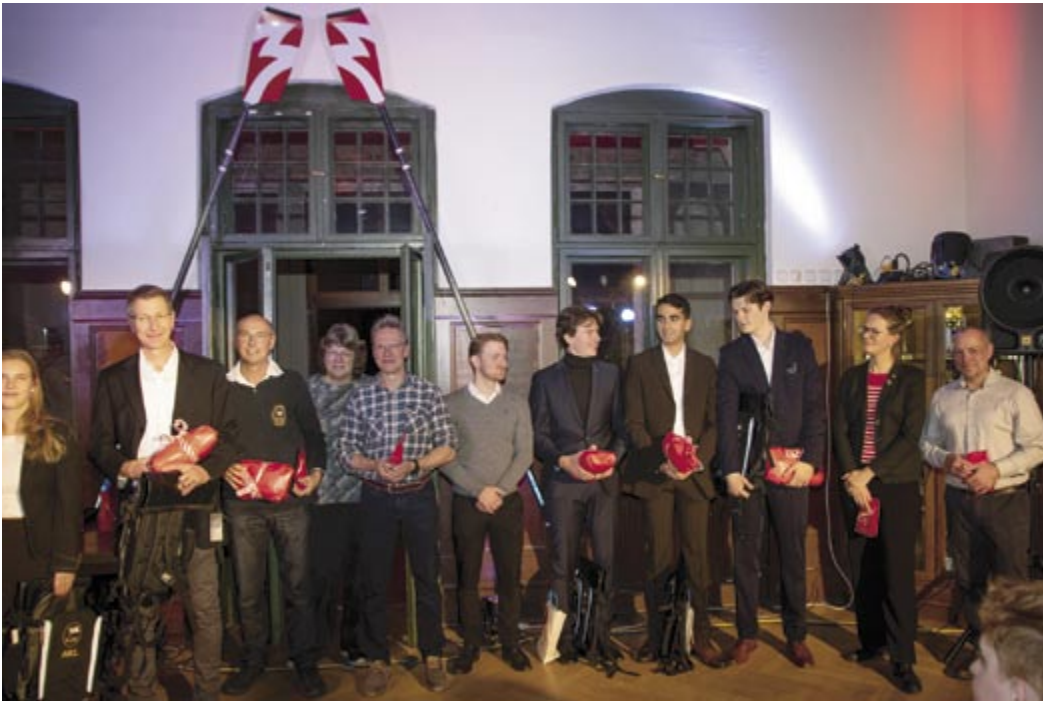
Dank an alle Helfer, vor und hinter den Kulissen