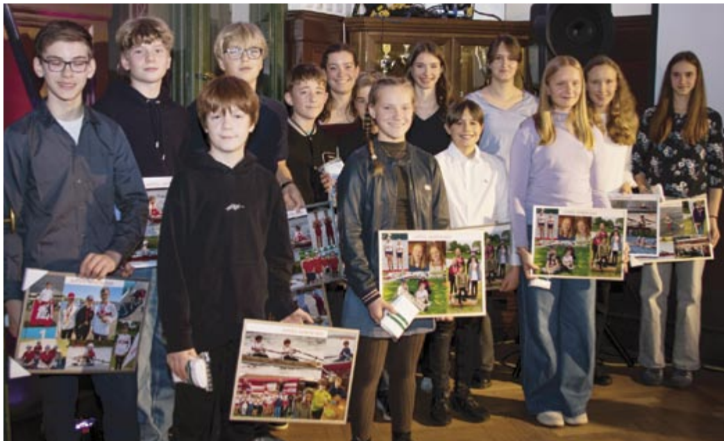
Der A-Pool mit den Foto-Collagen der Saison 2025