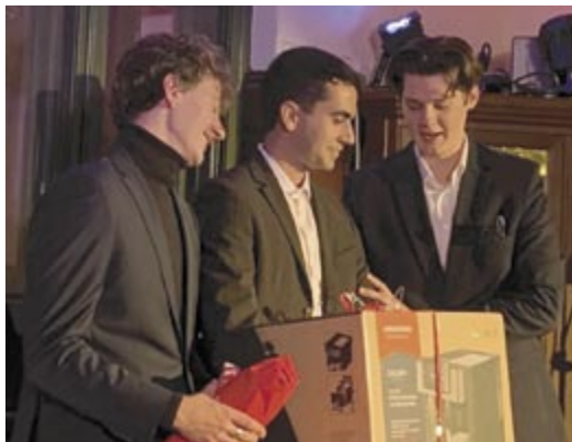
Das Trainer-Trio mit DEM Geschenk auf der Siegesfeier: das ist der Grund für den Kaffeeduft im 2. OG ...