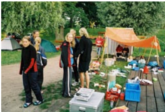
Für die Essenvorbereitungen konnte hier mal eine der seltenen Regenspauzen genutzt werden.

Während also manche Mannschaften versuchten, der neu erstandenen Versuchung zu widerstehen, machten sich andere ans Werk, mit Hilfe eines Skulls an einigen Stellen der Seen Tie-