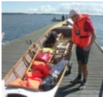
See-Gig und Schwimmweste gehören einfach dazu.