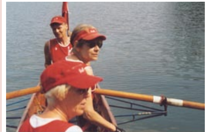
Wo bleiben die anderen Boote ?

Der Naturpark Feldberger Seenlandschaft scheint eine