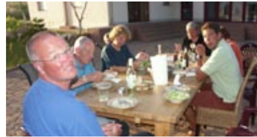
Zusammen abendessen, soviel Harmonie und Hitze waren fast unerträglich...

Wir rudern von Sellin um das Mönchsgut bis Lauterbach. Zu unserem Glück vollzieht der Wind unsere Richtungsänderungen mit und schiebt uns den ganzen Tag an, was zu einem