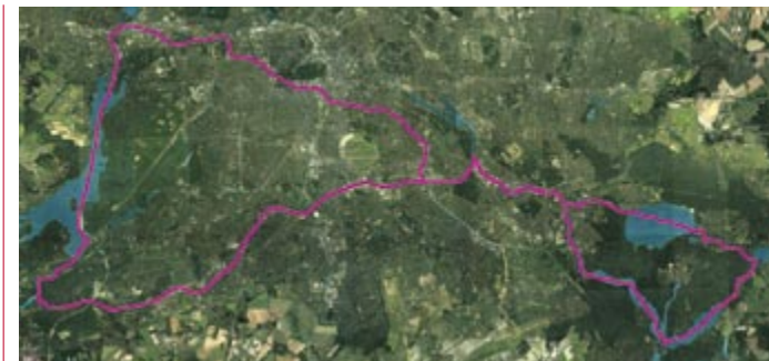
Der Verlauf der Fahrt.

Von dort startete am Samstag um 9:30 die zweite Etappe durch den Britzer Zweigkanal, Köpenick, weiter auf der Spree durch Friedrichshagen, über den Müggelsee nach Rahnsdorf zur Einkehr im örtlichen Ruderverein. Die Fahrt durch den Gosener Graben war in diesem Jahr wegen einer Vielzahl umgestürzter Bäume ein ganz besonderes Vergnügen. Danach ging es über den Seddinsee nach Schmöckwitz, durch Grünau über die Regattastrecke, nochmal durch Köpenick und Oberschöneweide bis zur RG Treptow. 48 km hatte das GPS aufgezeichnet. Entgegen