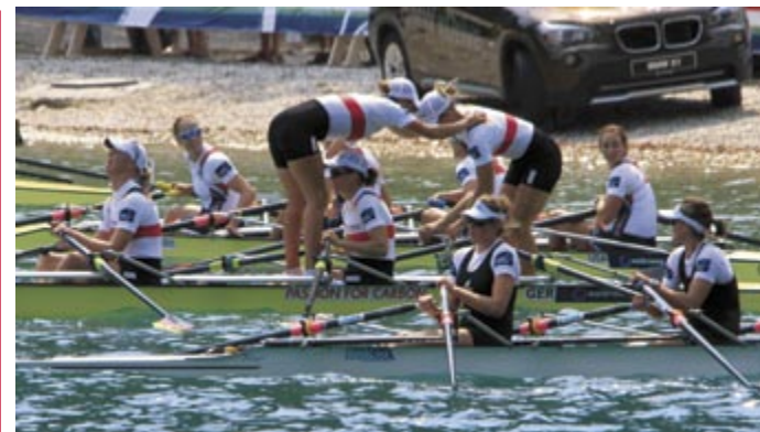
W E L T M E I S T E R I N N E N

Da der See nur etwa 2.2 km lang ist, liegt der Start direkt