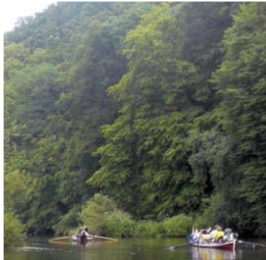
Landschaftliches Panorama im Hunsrück auf der Lahn.

bauen, Boote beladen und ablegen. Das Wetter spielte die meiste Zeit über mit, nur gelegentlich wurde es windig und die Sonne wurde von Wolken verdeckt. Wir fuhren mit gemischten Gefühlen los. Auf der einen Seite die Freude auf den letzten Pausentag in Koblenz, ein weiches Bett zu Hause und Mamas leckeres Essen. Auf der anderen Seite das Gefühl, dass diese Etappe die Wanderfahrt und damit auch die tollen zweieinhalb Wochen beenden sollte. Die Mannschaft der „Nerisona“ packte vorausschauend Spritzbesteck ein und setzte ihren Plan vom Anzetteln einer Wasserschlacht nach einigen Kilometern um. Man verbündete sich mit der Mannschaft der „Wannsee“ und attackierte die „Orangerie“, die innerhalb kürzester Zeit komplett durchnässt war. Als nächster Kandidat wurde die „Vier Muskeltiere“ ausgewählt, deren Mannschaft