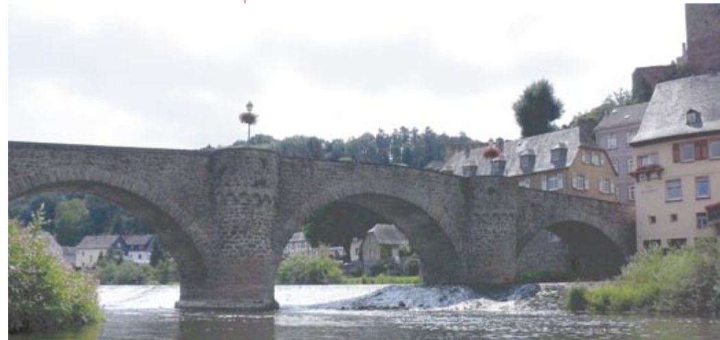
Solch ein mittelalterliches Panorama erwartet einen in den zahlreichen kleinen Örtchen entlang der Lahn.