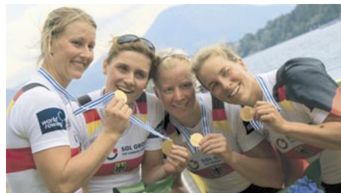
Wer strahlt hier mehr? Die goldenen Medaillen oder die vier Frauen?

Endlich war es also so weit: Donnerstag, Finale! Der Frau-