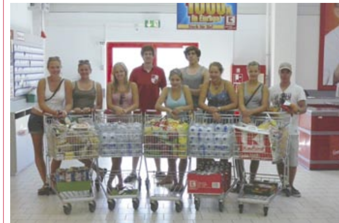
Das Überfallkommando beim Einkaufen der Vorräte für die nächsten Tage. Dieses Foto wurde möglich durch die nette Kassiererin im Kaufland Trier, die den Inhalt dieser 5 Einkaufswagen mit einem Grinsen über das Band zog.