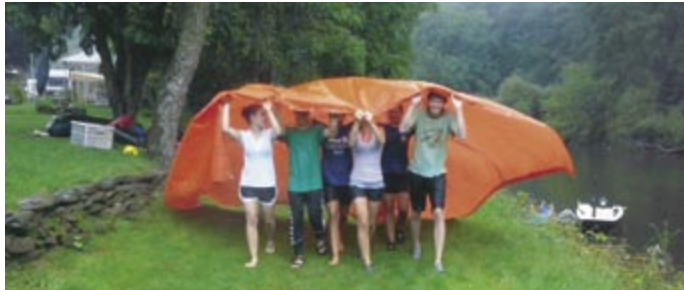
Diese orangene Plane ist eins der nützlichsten Utensilien einer Wanderfahrt. Es verhindert den nächtlichen Diebstahl von Essen, kann als Segel genutzt werden oder dient wie in diesem Fall als Notdach bei plötzlichem Platzregen.