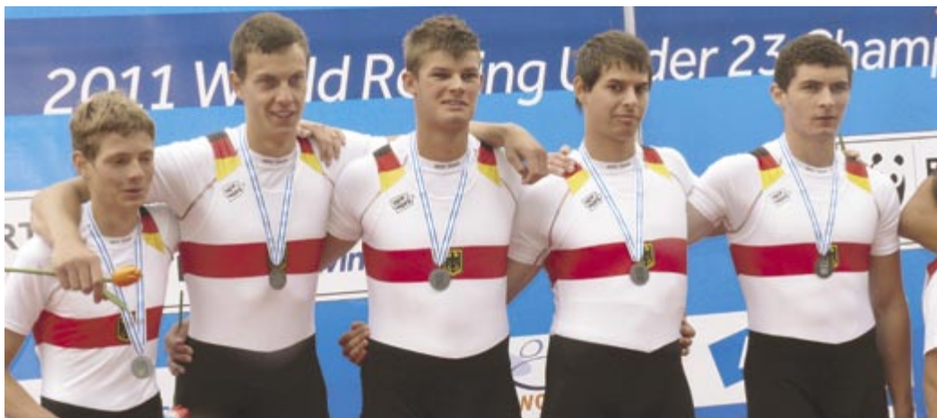
Silbermedaille bei den U23-Weltmeisterschaften in Amsterdam im Vierer-mit Steuermann

Anm. d. Redaktion: Auch Kevin Rakicki startete auf der U23-WM. Seine Mannschaft belegte im Männer-Achter nach dem 3. Platz im Vorlauf und dem Sieg im Hoffnungslauf am Ende Platz 4 im A-Finale (4 Boote-Feld)